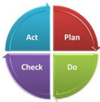
Fig. 3 Ciclo di Deming

La visualizzazione in forma circolare sottolinea la necessità di una continua ripetizione della loro successione, per portare a una nuova pianificazione sulla base dell'esperienza acquisita.