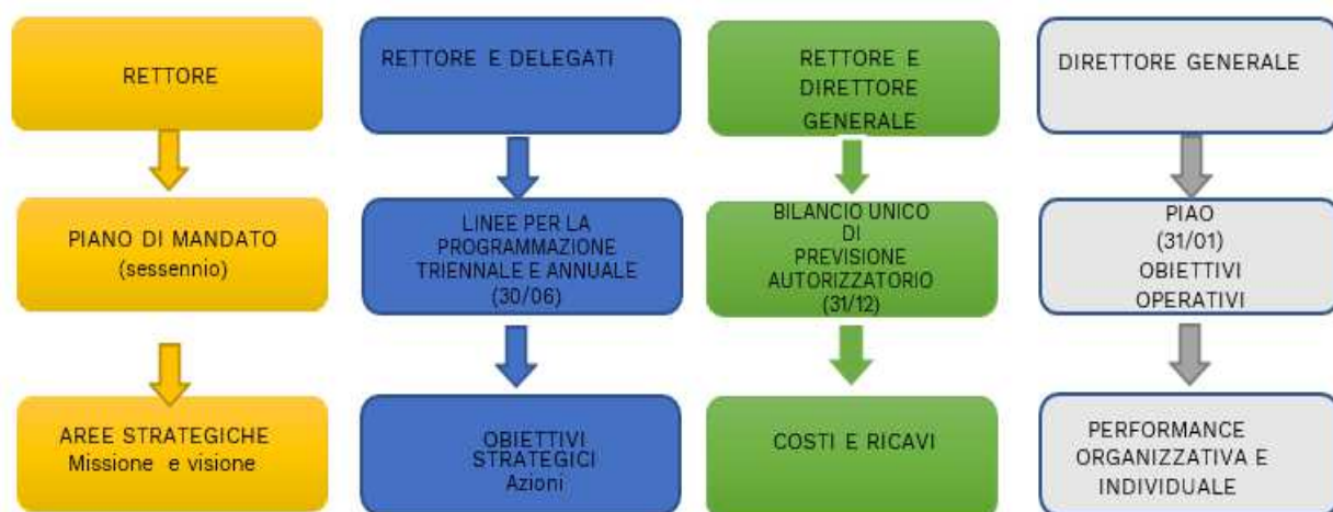
Figura 1 Quadro dei principali documenti di programmazione, con fasi ed attori

realizzarle (performance) e le risorse necessarie (bilancio).