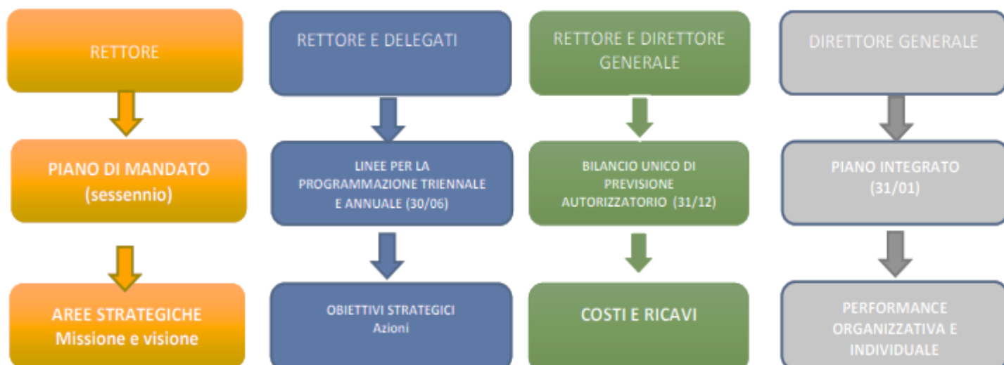
Figura 1 Quadro dei principali documenti di programmazione, con fasi ed attori

Ai sensi dell'art. 23 del Regolamento di Ateneo per l'Amministrazione, la Finanza e la Contabilità, il Direttore generale, entro 10 giorni dall'emanazione delle Linee per la programmazione triennale e annuale, definisce il calendario delle attività per la formazione del Bilancio. Di seguito si riporta il "Calendario di massima delle attività bilancio - performance".